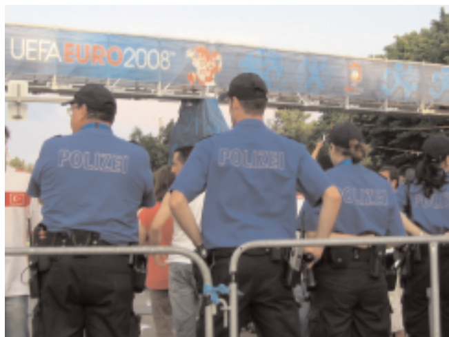
Unter dem Willkommensbanner der Uefa: Alles Polizei

Viel bedenklicher jedoch als diese Vorfälle sind die strukturellen Entwicklungen im Sicherheitsbereich, die im Zusammenhang mit der EM stattgefunden haben. Im Vorfeld wurden massive Bedrohungsszenarien aufgebaut, die das gigantische Sicherheitsaufgebot legitimieren sollten. Der äusserst undifferenziert verwendete Ausdruck «Hooligan» wurde zum Inbegriff einer diffusen Gefahrensituation im Hinblick auf die Euro 08. Und für diejenigen, die sich nicht genug vor dem «Hooligan» fürchteten, wurde erwartungsgemäss auch noch der «Terrorist» ins Feld geführt. Vor dem Hintergrund dieser «Gefährdungslagen» konnte dann in aller Ruhe der gigantische Sicherheitsapparat hochgefahren werden, der für jede Bedrohungssituation die richtige Antwort bereit hatte: Datenbanken und Einreisesperren für die «Hooligans», Kampfjets über den Stadien für die «Terroristen», Videokameras, Sonder-