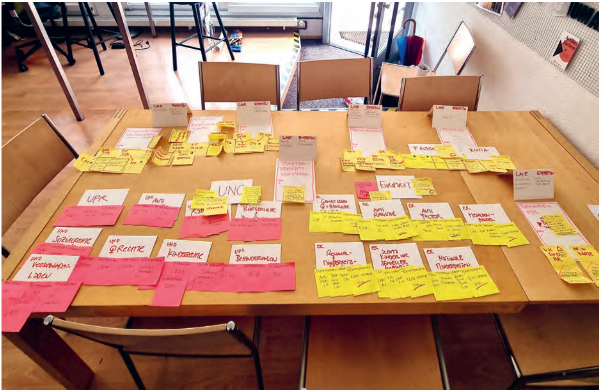
Ausgeordnung im Rahmen des ersten Workshops zur Analyse der Inhalte und Vorschlag zur neuen Darstellung

dem Team der SMRI entwickelten wir ein neues inhaltliches Konzept: Wie sollen die Informationen künftig strukturiert sein? Wie werden sie gesucht und gefunden? Welche Begriffe passen zur Rolle der neuen Institution?